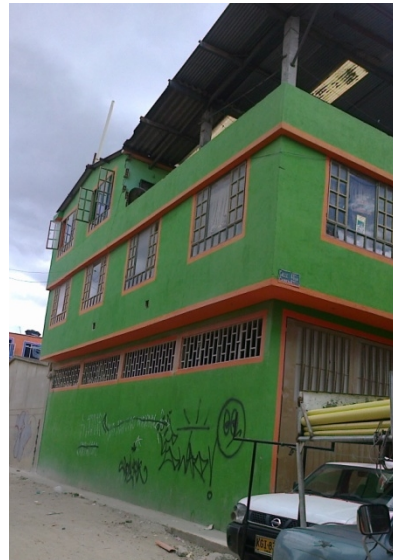
FOTOGRAFÍA 2: FACHADA DEL PREDIO