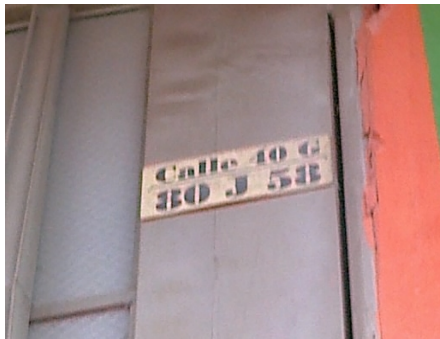
FOTOGRAFÍA 1: NOMENCLATURA DEL PREDIO